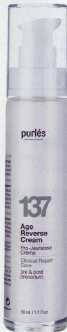
NAPRAWCZY KREM ODMŁADZAJĄCY AGE REVERSE CREAM 137, PURLES, 119 ZŁ (WWW.SKLEP.PURLES.PL)