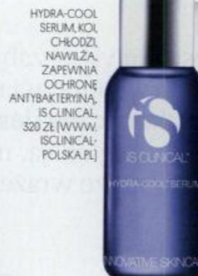
HYDRA-COOL SERUM, KOI, CHŁODZI, NAWILŻA, ZAPEWNIĄ OCHRONĘ ANTYBAKTERYJNĄ, IS CLINICAL, 320 ZŁ (WWW. ISCLINICAL- POLSKA.PL)