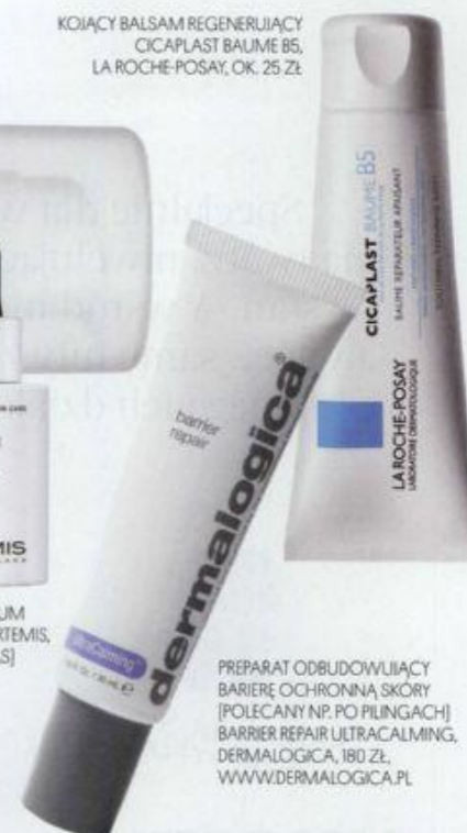
KOJĄCY BALSAM REGENERUJĄCY CICAPLAST BAUME B5, LA ROCHE-POSAY, OK. 25 ZŁ

Po takich zabiegach jak mezoterapia czy laser warto stosować specjalne kosmetyki łagodzące podrażnienia . Nie tylko koją i regenerują, ale i podtrzymują efekty!