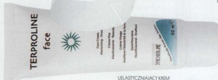
UELASTYCZNIĄCY KREM DO TWARZY TERPROLINE, SYNCHROLINE, 89 ZŁ