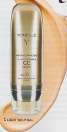
1 LIGHT NEUTRAL